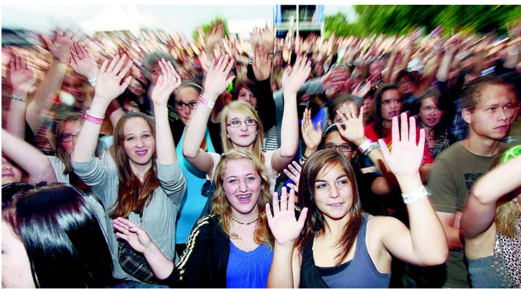
«Wave your hands» – das Publikum machte bei den Konzerten mit Begeisterung mit.